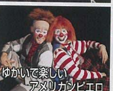
ゆかいて楽しい アメリカンピエロ