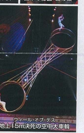
ウィール・オブ・デス 地上15m決死の空中大車輪