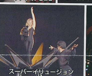
スーパーイリュージョン