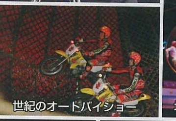
世紀のオートバイショー