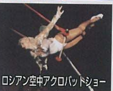
ロシアン空中アクロバットショー