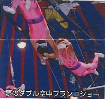
夢のダブル空中ブランコショー