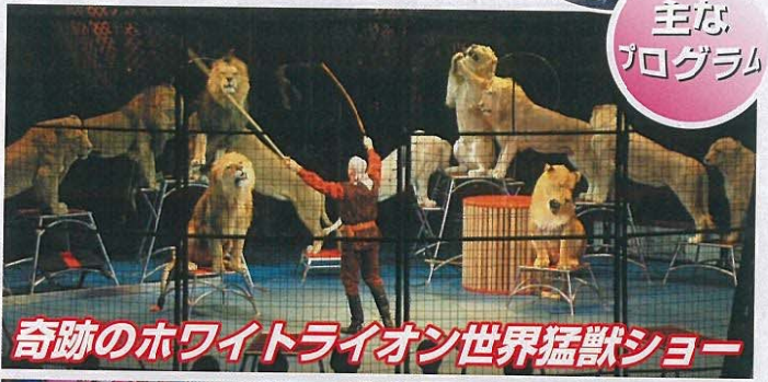
奇跡のホワイトライオン世界猛獣ショー