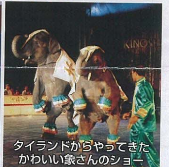
タイランドからやってきた かわいい象さんのショー