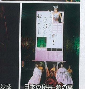
日本の秘芸・葛の葉